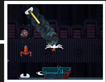
Birbirinden Farklı Görev ve Alanlar