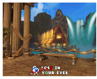
Etkileyici Alan Tasarımı