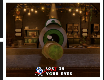
Sürükleyici Eşli Oynanış